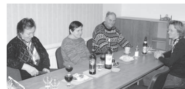
Slavnostní předání cen v nově zrekontrovaných prostorách OÚ

■ Ještě v prosinci proběhlo slavnostní předání finančních odměn vítězům soutěže „O nejhezčí vzhled domu a jeho okolí“ (viz foto). Je tu ale již nový rok 2008. Čeká nás spousta novinek, které pro nás připravila vláda ČR, ale něco také náš obecní úřad.