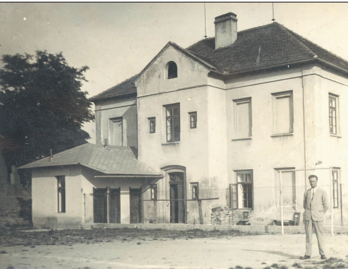
Toto je jeden z mála historických obrázků, které máme k dispozici, rádi bychom pokračovali ve zveřejňování těchto zajímavých snímků a proto vás prosíme, zapátrejte ve svých archívech a poskytněte snímky k pořízení kopie, originály vám budou vráceny. Děkujeme.